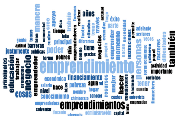
Figura 2. Resultado del análisis de nube de palabras de las fuentes de investigación.

Con respecto a las palabras clave en los textos codificados dado la importancia del proceso que engloba el determinar si los activos y pasivos de la pobreza sobresalen en los discursos de los emprendedores, se exploró la relación de la palabra “emprendimiento” seguido de “educación